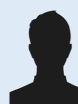
Compagnie BAS-ARMAGNAC ADOUR